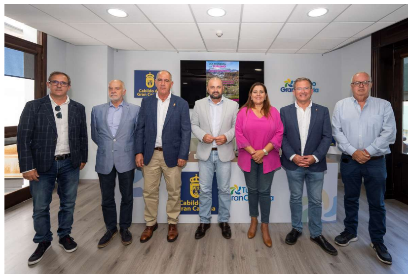
Imagen: Rueda de Prensa actos Día Mundial del Turismo

En este año 2023 se celebró, en colaboración con Turismo Gran Canaria, junto a los once ayuntamientos pertenecientes a la Mancomunidad, el Día Mundial del Turismo en la Laguna de Valleseco.