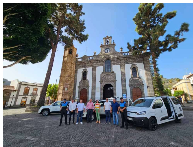
Imagen: acto de entrega de varios vehículos celebrado en Teror