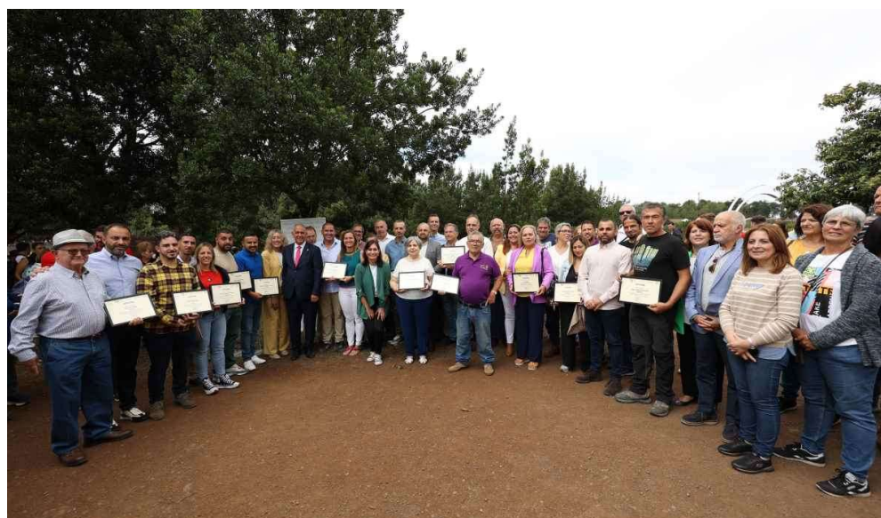
Imagen: Acto de entrega de los diplomas de reconocimiento turístico del Norte de Gran Canaria

El programa diseñado para el Día Internacional del Turismo contempló la entrega de los premios de reconocimiento al turismo en el Norte de Gran Canaria, en el apartado Ocio a las empresas Eco free tour-Gran Canaria Mar y Tejeda (Tejeda) y al Museo del Plátano (Aruca). En el apartado restauración: al Bar- restaurante Tasca Juan Pedro (Gáldar), a la Dulcería Benítez (Teror) y al Restaurante Grill Mesón Los Chorros (Firgas). En el apartado alojamiento: a la Vivienda Starlight de La Aldea (La Aldea de San Nicolás) y a las Casas Rurales Las Rosas (Agaete). En el Apartado de sostenibilidad: a La Bodega (Santa María de guía) y a la Finca La Tapia (Moya). En el apartado Innovación Turística: a la empresa Abraham Romero González, S.L. (Artenara) y a los Lagares de Valleseco (Valleseco).