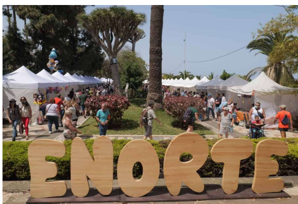
Imagen del Jardín Municipal de Arucas

La XXI Feria Empresarial del Norte de Gran Canaria: ENORTE, celebrada en la ciudad de Arucas del 24 al 26 de marzo del año 2023 , ha mostrado su consolidación como uno de los eventos empresariales más importantes celebrados en la Isla de Gran Canaria, desde su constitución como primera feria comarcal en el año 2002 en el que se celebró su primera edición.