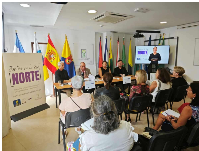
Imagen: rueda de prensa presentación del proyecto

La campaña de comunicación se realizó a través de influencers en las redes sociales (facebook, instagram, tic toc, youtube), siendo pionera en Canarias como herramienta para contribuir a la educación familiar contra el uso de la violencia y la pornografía.