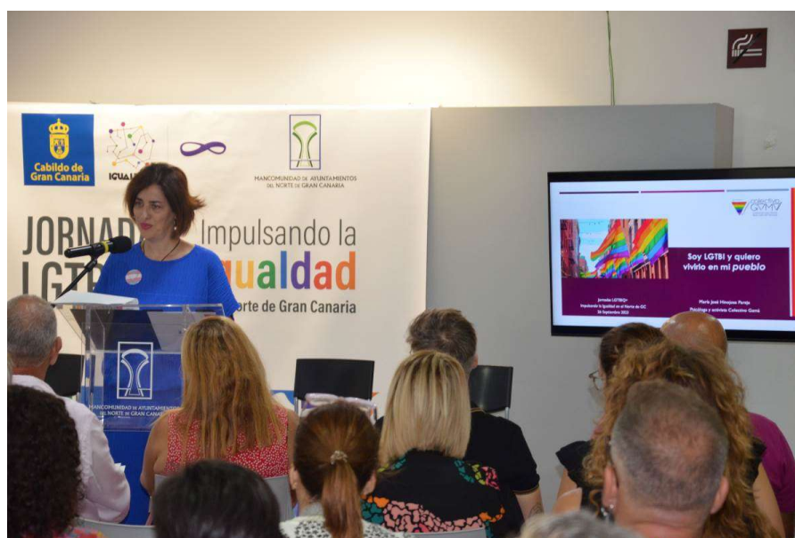
Imagen: inauguración de las Jornadas