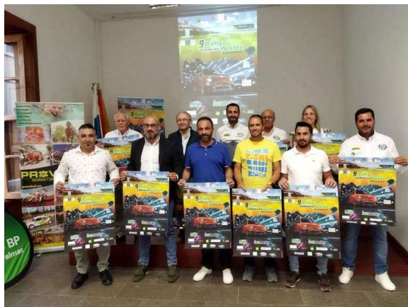
Imagen: Rueda de prensa presentación Rallye.

La Mancomunidad del Norte colaboró con la novena edición del Rallye Comarca Norte de Gran Canaria, organizado por el Club Deportivo Azuatil, que se celebró los días 7 y 8 de julio en las carreteras de varios municipios norteños.