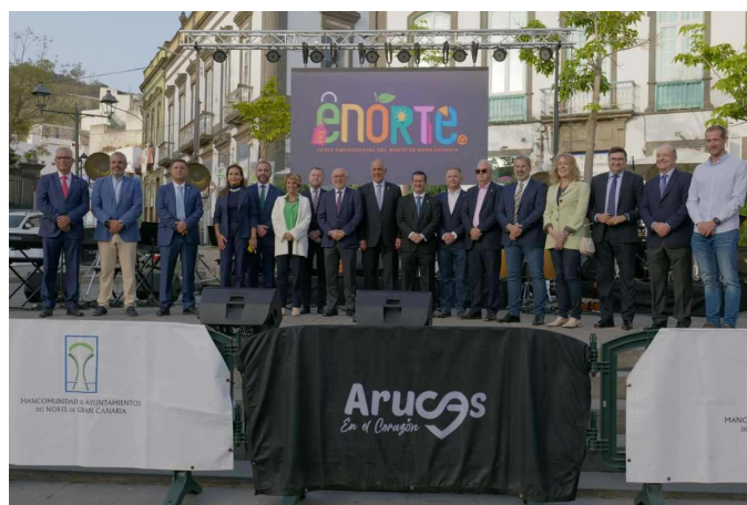
Imagen de la inauguración de la Feria