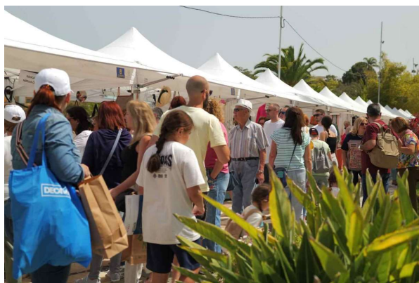
Imagen parque municipal de Arucas

ENORTE2023 contó con la asistencia de más de 50.000 personas, durante los tres días de celebración de la Feria, llenando las calles de la zona comercial abierta y el casco histórico de Arucas, municipio anfitrión, que ha sido testigo de su desarrollo en una edición en la que se ha recuperado la apuesta por la fusión de la muestra con las zonas comerciales abiertas y se ha continuado con la potenciación de la cultura Km0.