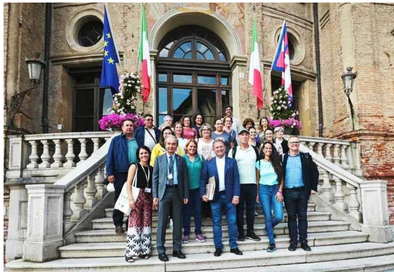
Imagen: visita al Alcalde de la ciudad de Bra

representantes de la organización de la Feria “Slow Food” con el objetivo de establecer líneas de colaboración.