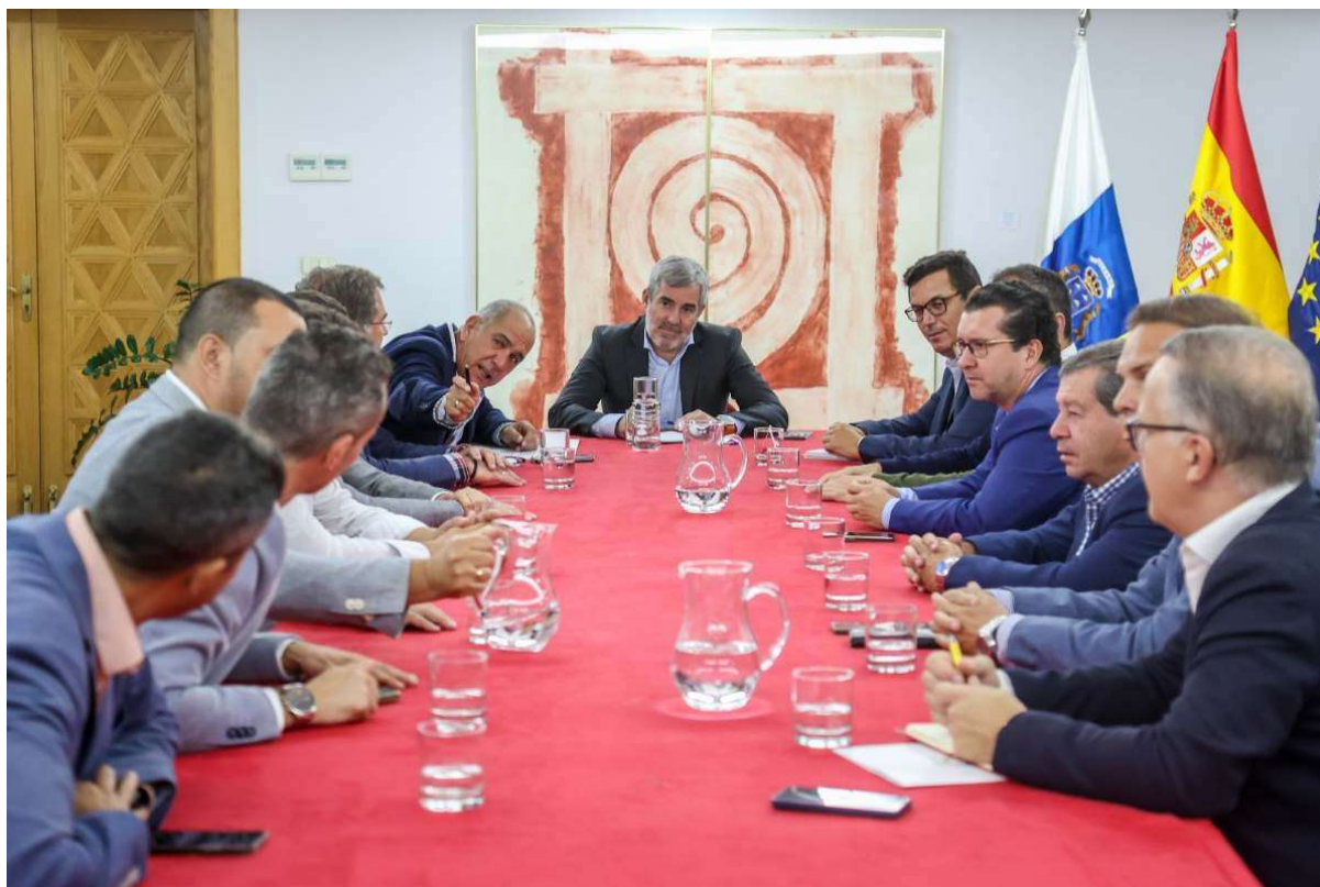
Imagen: Visita al Presidente del Gobierno de Canarias

A lo largo del año 2023 la Mancomunidad ha mantenido una intensa agenda de trabajo con el resto de instituciones, empresas y agentes sociales con el objetivo de abordar diferentes aspectos de relevancia para la Comarca.