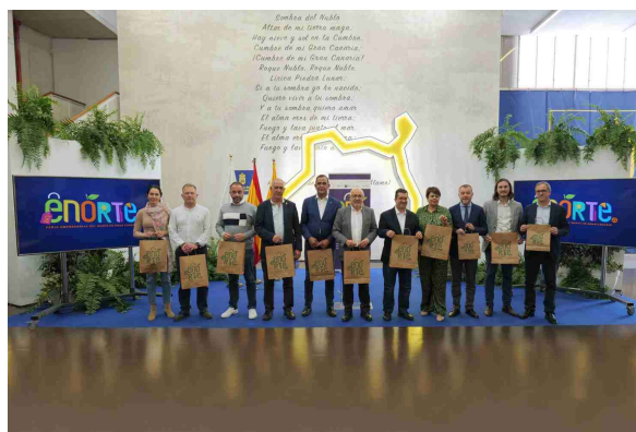
Imagen de la presentación en el el Cabildo de Gran Canaria