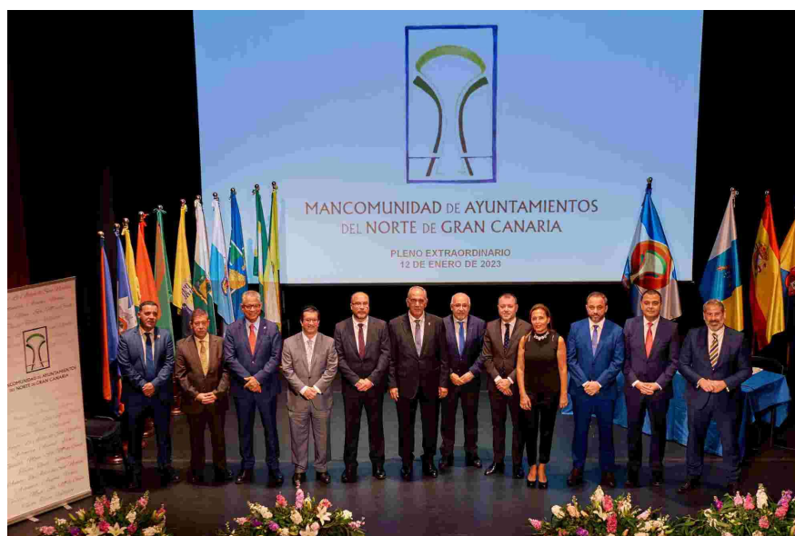
Imagen: Pleno de la Mancomunidad 11/01/2023.

Durante el año 2023, el municipio de Teror ha ostentado la presidencia de la Mancomunidad, y las vicepresidencias, los municipios de Valleseco y Gáldar. En enero de 2023 se produjo el cambio de presidencia anual, en el Nuevo Teatro Viejo de Arucas.