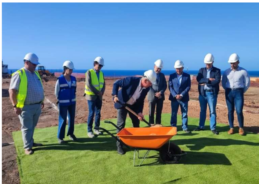
Imagen: primera piedra de la fase I de urbanización

En 2023 se finalizó la I fase de la urbanización de la parcela con cargo a los fondos europeos (FEDER), a través de la ACIISI, para finalizar esta actuación de puesta en marcha definitiva del parque. Las obras se adjudicaron a la empresa OHL en el mes de enero de 2023 y las mismas finalizaron en verano.