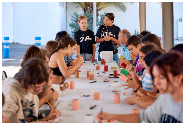
Imagen: taller del proyecto Bucle.

En los talleres educativos que se realizaron durante toda una mañana, participaron alumnado del CEO Luján Pérez, IES Noroeste e IES Guía.