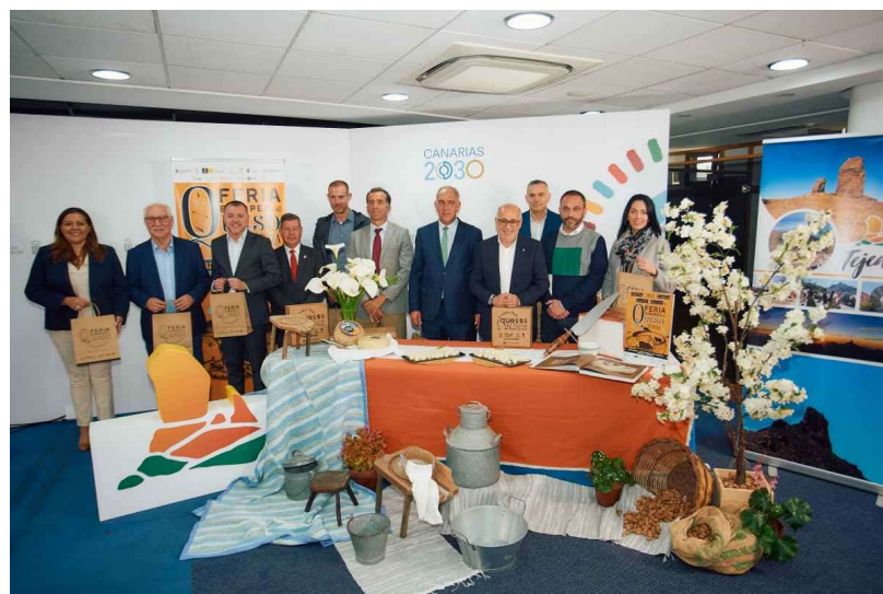
Imagen: Rueda de prensa presentación de la feria