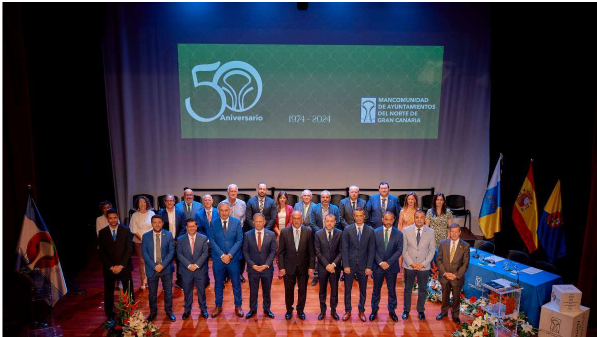
Imagen: Pleno de la Mancomunidad 26/07/2023.

En el siguiente cuadro se muestran las fechas de las Juntas de Gobierno celebradas a lo largo del año 2023: