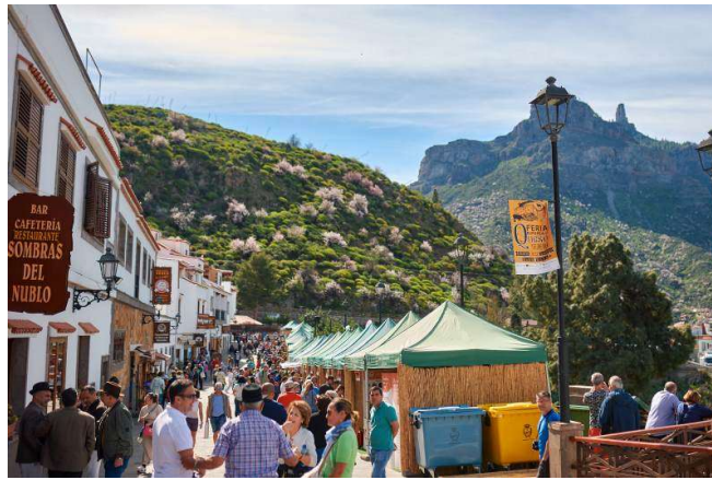
Imagen: Calles de Tejeda durante la celebración de la Feria

La afluencia de público superó la cifra de 25.000 personas asistentes al evento entre el sábado y el domingo, datos estimados por la organización.