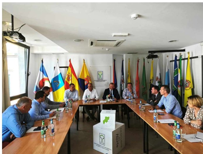
Imagen: Reunión celebrada con el Vicepresidente del Cabildo y Consejero de Obras Públicas e Infraestructuras, Arquitectura y Vivienda

También se planteó la necesidad de seguir mejorando la iluminación de la vía para garantizar la seguridad de la misma en aquellas zonas que se compruebe su viabilidad, atendiendo a los criterios de contaminación lumínica permitidas en el trazado de la vía.