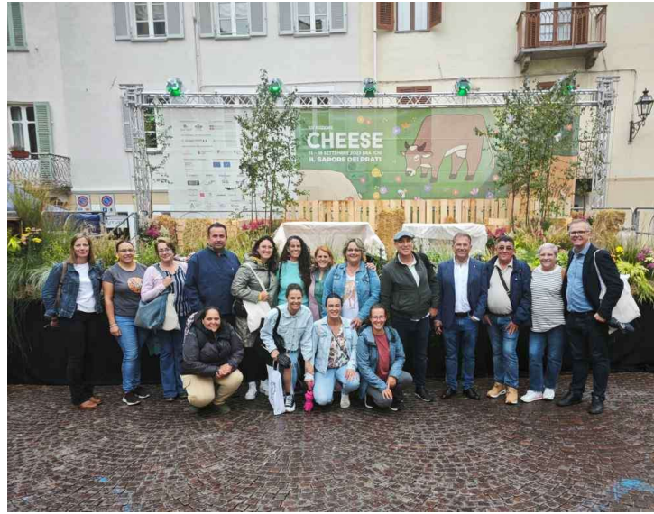
Imagen: delegación de la Mancomunidad del Norte asistente a la feria