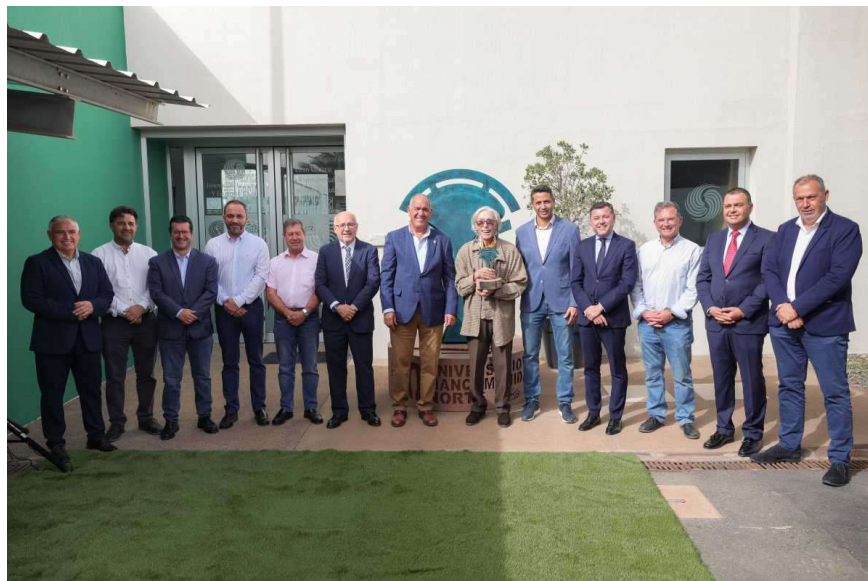
Imagen: : Inauguración de la escultura

Al acto de inauguración asistió el Presidente del Cabildo, Antonio Morales, que quiso acompañar a los Alcaldes y a todos los Concejales, miembros del pleno de la entidad, en este primer evento conmemorativo del 50 aniversario de la Mancomunidad de Ayuntamientos del Norte de Gran Canaria, que culminará en junio de 2024, además de arropar al artista norteño en las celebraciones de su 90 cumpleaños.