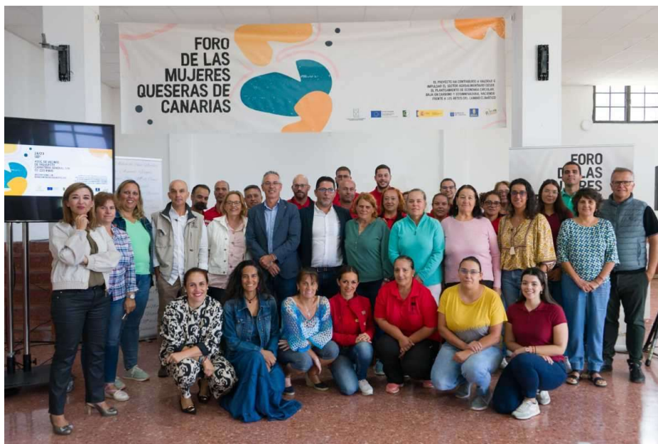
Imagen: asistentes al foro

El 29 de septiembre se organizó, en la Asociación de Vecinos de Fagajesto, el primer foro de queseras de Canarias organizado por la Mancomunidad del Norte de Gran Canaria, con el objetivo de visibilizar el papel de las mujeres queseras en el sector.