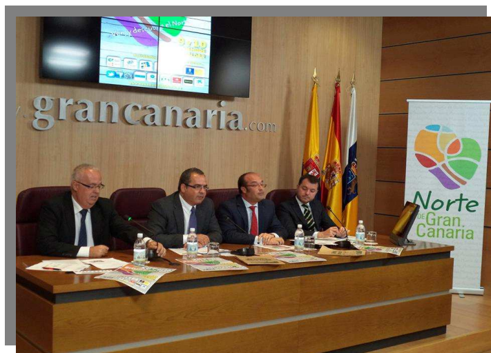
Imagen de la rueda de prensa de presentación de la Feria en el Cabildo de Gran Canaria